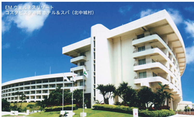
EM ウェルネスリゾート コストビスタ沖縄 ホテル&スパ (北中城村)

2020年4月より EMコストビスタとノボテル沖縄那覇のいずれかをお選び頂けます。