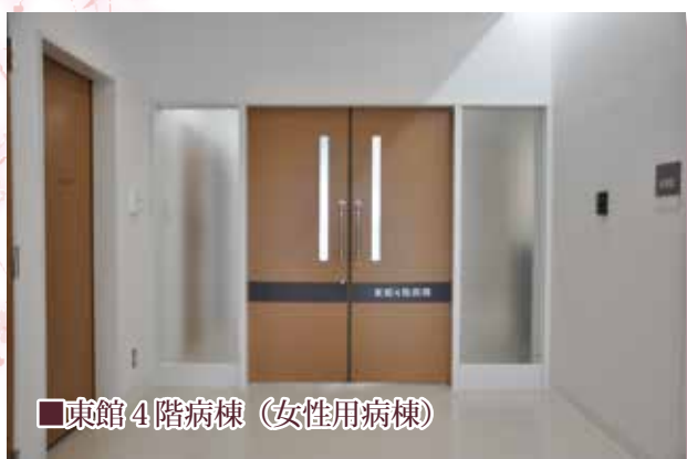
■東館4階病棟 (女性用病棟)