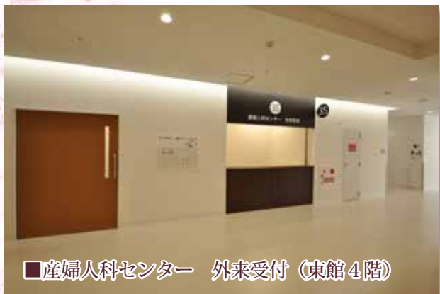
■産婦人科センター 外来受付 (東館4階)