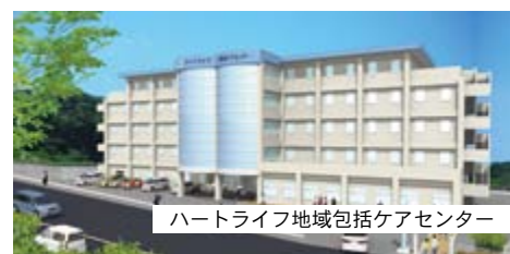
ハートライフ地域包括ケアセンター

ご利用方法やその他サービス内容など、詳しくは各市町村役場の窓口、または当院患者相談窓口までお問い合わせください。また、診療や費用などについてもお困りのことがありましたら、本館1階⑩番の患者相談窓口まで、お気軽にご相談下さい。